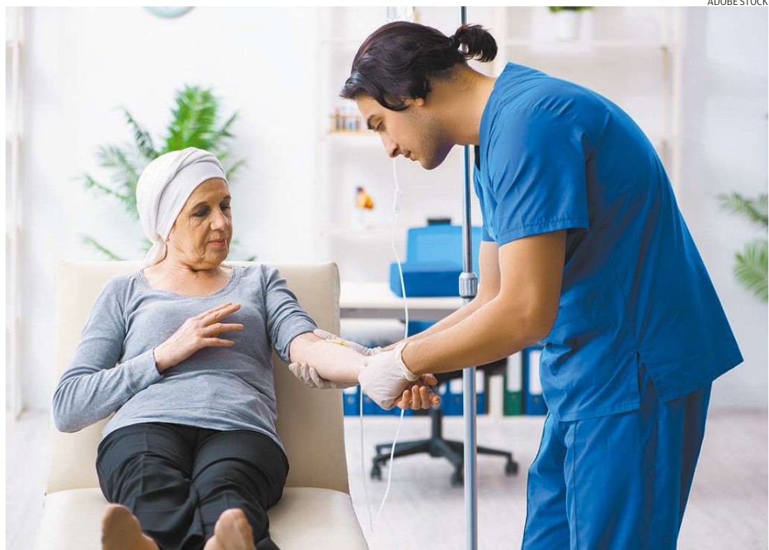
Recomendação é que aqueles que precisam de tratamento constante não o interrompam neste momento

com preocupação a demanda represada. “Isso também coloca em risco a saúde financeira das empresas. E se elas não sobreviverem, como poderão atender a população depois?”